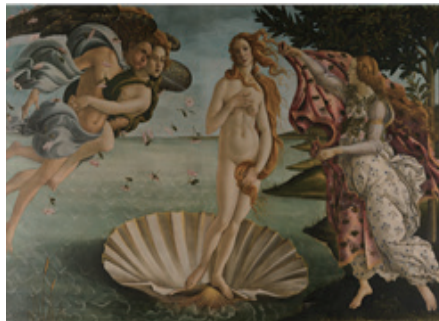
르네상스 시대의 예술 작품