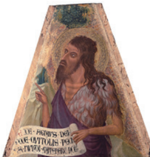
중세 예술의 예술작품

사실주의의 목표는 사실적으로 드러내는 것인데, 사진이란 목표가 같다는 것에서 필요성에 대한 논의가 있었다. 그러나, 결론은 리얼리즘은 '현실'을 적나라하게 보여주는 것이 목표이다. 현실성은 실제 모습이지만, 사실성은 일상 생활에 가까운 성질이다. 리얼리즘은 사실성을 추구하고, 사진과 하이퍼리얼리즘은 사실성에 현실성까지 추구한다. 그러면 하이퍼리얼리즘의 의미는 어디서 나오는지 모호해지는데, 이는 인간이 사진과 견줄 수 있을 정도의 재현성을 갖는 것에서 의미가 생기는 것이다.